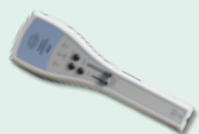
PA5 Audiometro pediatrico