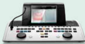
AC40 Audiometro clinico