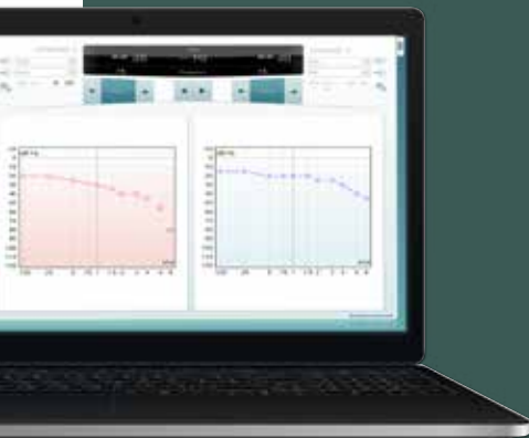
Diagnostic Suite-ohjelma (vain AS608e)