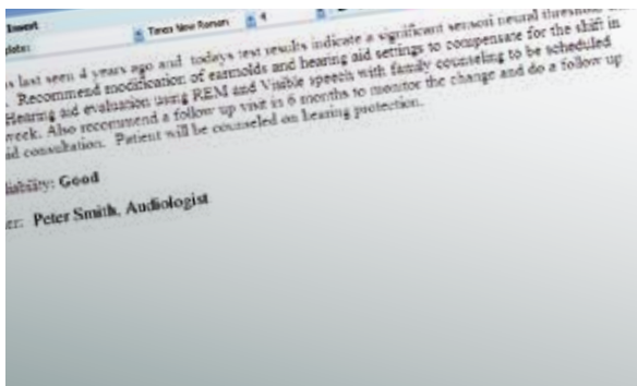
Raporttisivu Diagnostic Suite-ohjelmassa (vain AS608e)